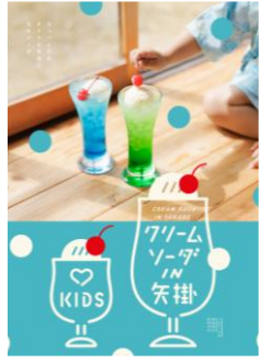
【桃源郷はなしの里】

明るい日射しと、キラキラソーダ。 いつしよに笑って、 いつしよに食べて。 矢掛で味わう クリームソーダは、 なんだかやさしい味がする。