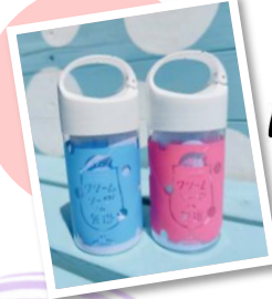
【問合せ】やかげDMO ☎ 0866-83-0001

明るい日射しと、キラキラソーダ。 いつしよに笑って、 いつしよに食べて。 矢掛で味わう クリームソーダは、 なんだかやさしい味がする。