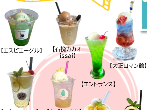
【エスピーエーグル】