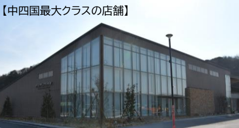
【中四国最大クラスの店舗】

2026・4/28(火)13時オープン (矢掛町民は11時から入場できます) 通常営業時間 10:00~19:00