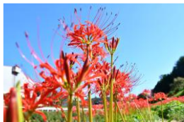
矢掛地区から県道35号線を北上、美川小学校の川向い

矢掛町美川地区の彼岸花群生地は、自然の美しさを堪能できる絶好のスポット！例年9月中旬頃から見頃となり川のほとりが赤いじゅうたんのようになられます。ぜひ、この時期に訪れその魅力を体感してみてください。