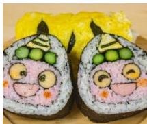
【画像はイメージです】