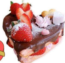
【画像はイメージです】

ケーキの画像は作成例です。飾り付けは自由です！手作りの特別なケーキを大切な人に贈ろう◎小さなお子さまも大人のサポートがあれば簡単に作れます。