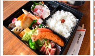
【画像はイメージです。時期により内容は変わります】